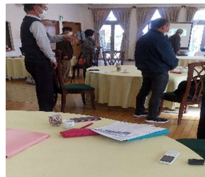
スクリーンに映して出席者を確認しました