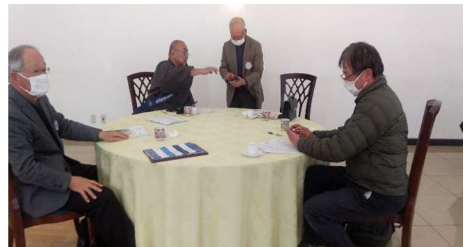
会員各自スマートフォンを取り出してお互いに操作を確認しています。