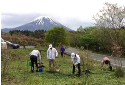
★RI 奉仕プロジェクトセンター/私のクラブのプロジェクトに登録されている写真例（富士山3776本ミツバツツジ植樹活動）